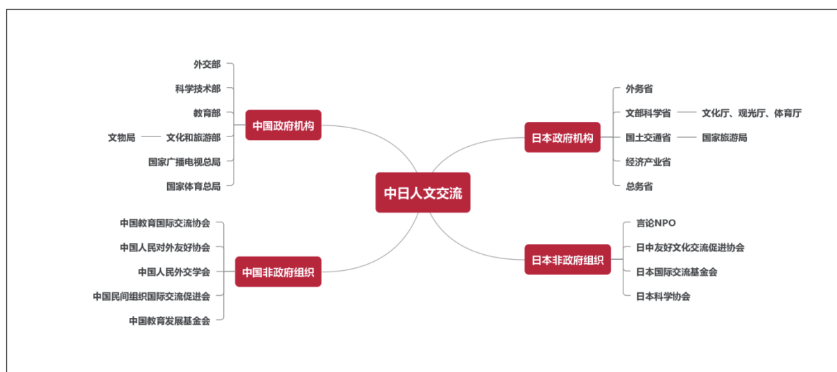
图1 中日人文交流相关机构

中日人文交流由官方和民间共同推动。在官方层面，中方的主要机构包括外交部、教育部、科学技术部、文化和旅游部、国家广播电视总局、国家体育总局等；日方的主要机构包括外务省、文部科学省、经济产业省、国土交通省、总务省等。在民间层面，两国也有许多非政府组织积极参与人文交流实践。中方的组织主要有中国教育国际交流协会、中国人民对外友好协会、中国人民外交学会、中国教育发展基金会、中国民间组织国际交流促进会等；日方的组织主要有言论 NPO、日中友好文化交流促进协会、日本科学协会、日本国际交流基金会等。